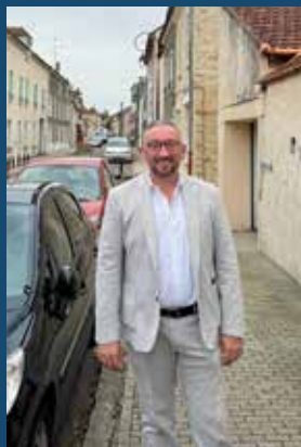
Votre dévoué Maire Franck Fontaine Maire de Mézières-sur-Seine